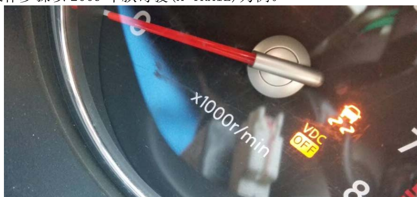
图 1：奇骏 VDC OFF 警告灯