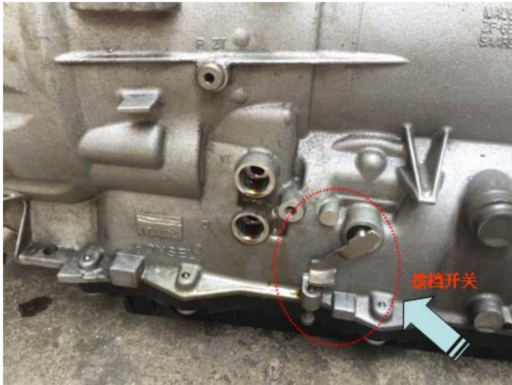
图 2: 换挡开关位置