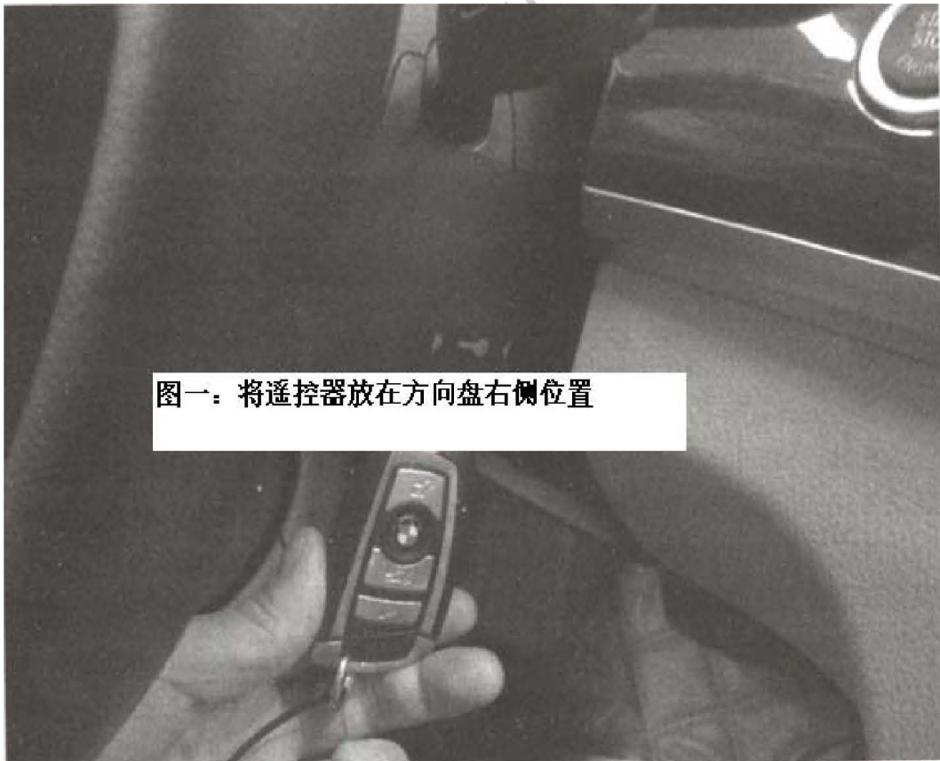
图一：将遥控器放在方向盘右侧位置