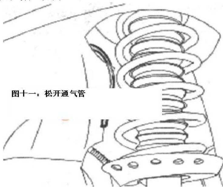
图十一：松开通气管