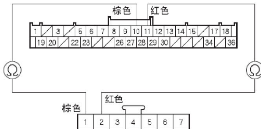
模式控制电机 7 针插接器 阴端子的线束侧