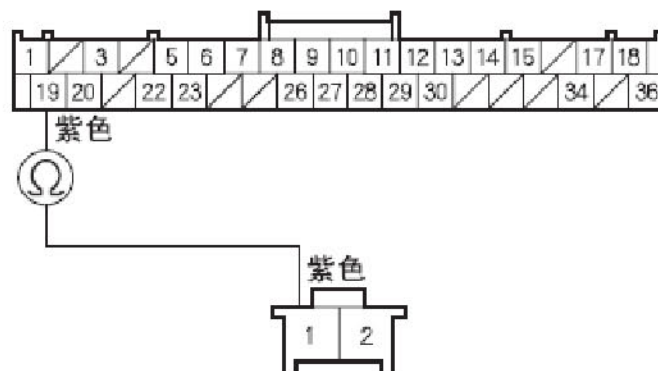
光照传感器 2 针插接器 阴端子的线束侧