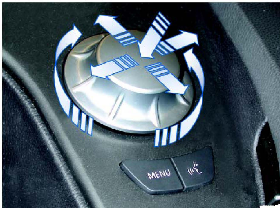
E60 控制器及其他操作按钮 (高级装备)