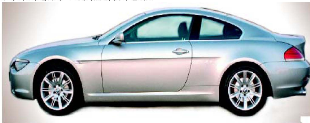
6 系列雙門轎跑車 E63