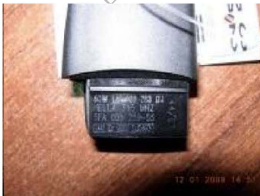
图 3 宝来 1J0 959 753 DJ