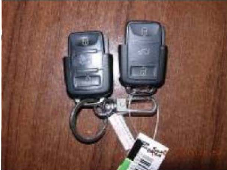
图 4 左为速腾 右为宝来