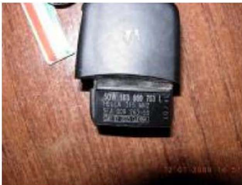
图 2 速腾 1K0 959 753