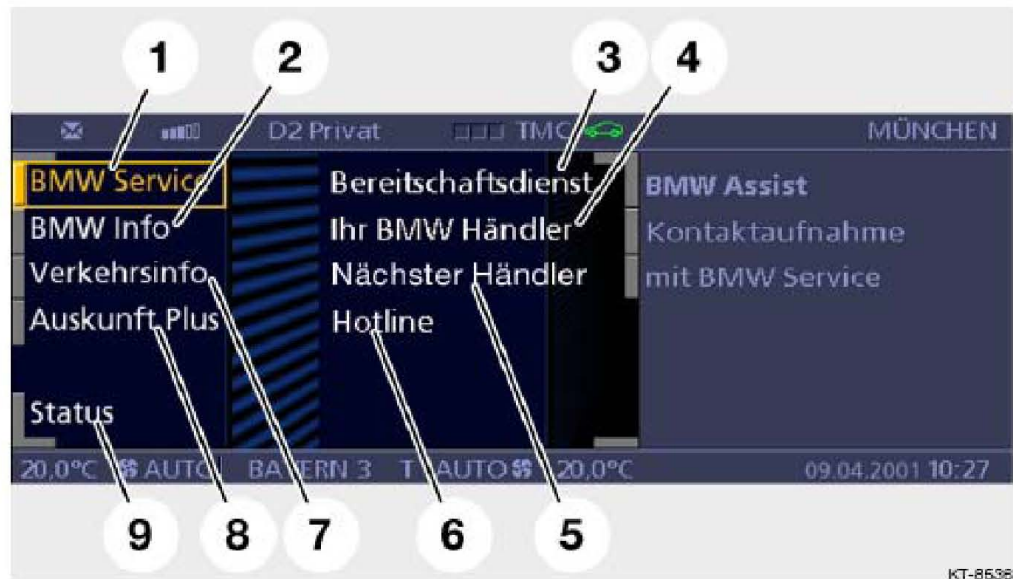
图 91: “BMW ASSIST” 菜单