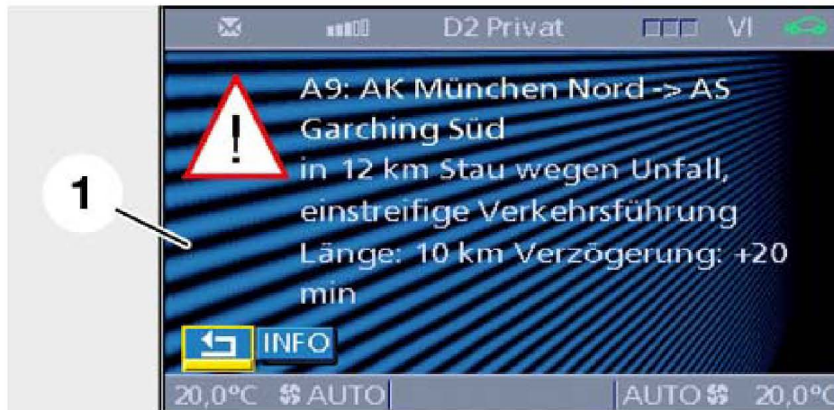
图 89; 第一个附加信息页面