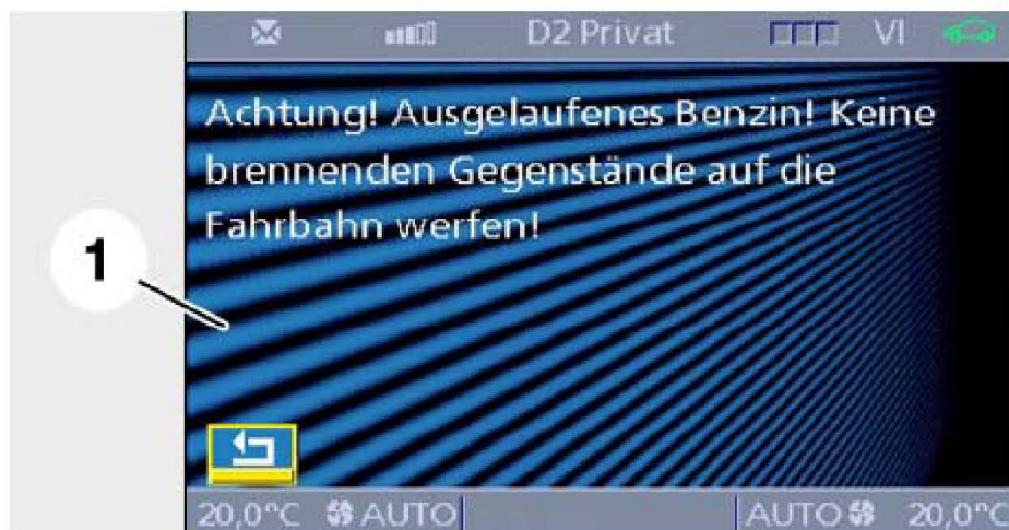
图 90; 第二个附加信息页面