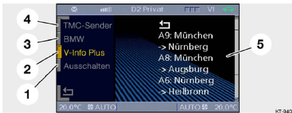
图 88: 交通信息列表