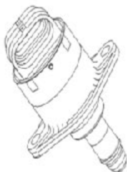
图 3-43 怠速执行器步进电机