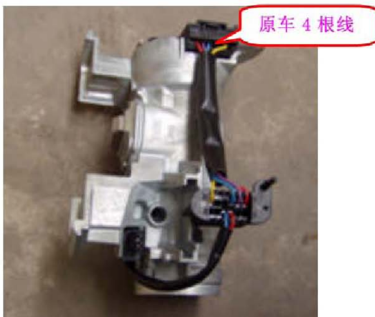
图 2 原车点火开关

A). 更换点火开关时发现原车点火开关只有 4 根线, 提供的备件为 6 根线。