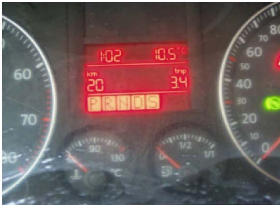
图 5 更换点火开关后仪表盘显示器显示状态

3). 更换为 6 线的点火开关后, 起动发动机时, 仪表多功能显示器各档位显示一片红色。