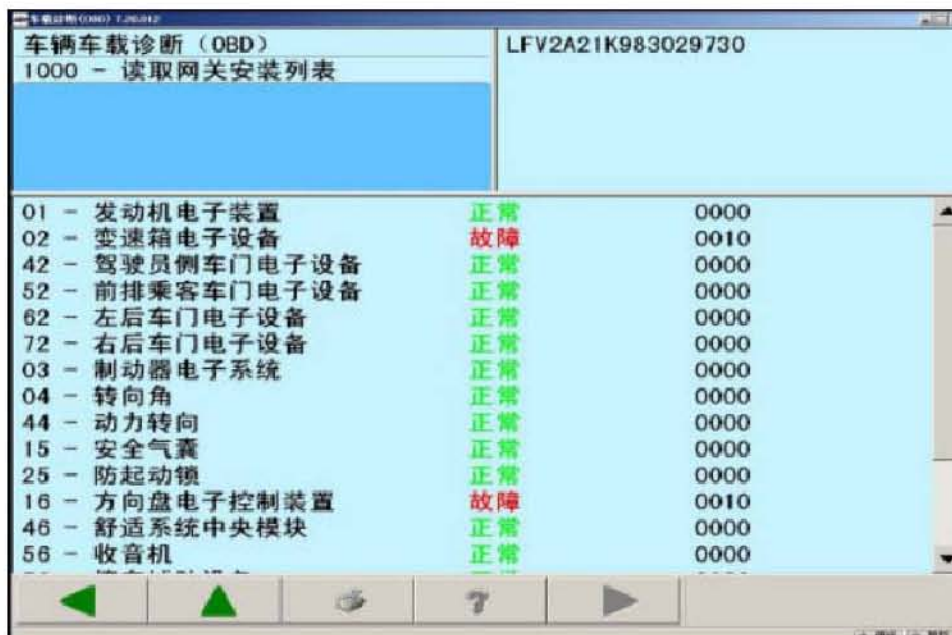
图 7 自变速箱控制单元和转向柱控制单元有故障