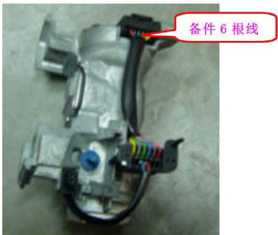
图 3 原车点火开关