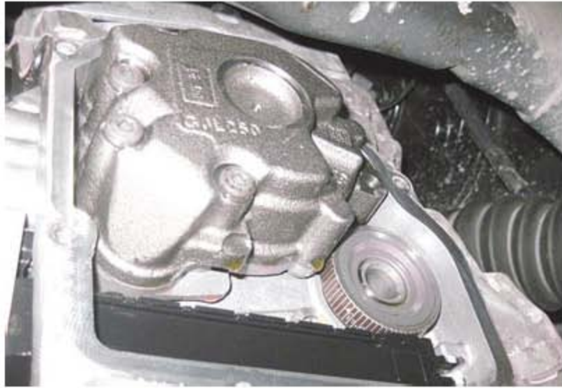
(图5) 注意输出轴 2 传感器支架的位置