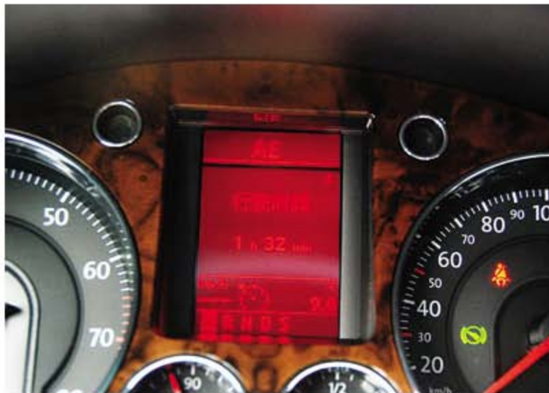
(图 1) 挡位指示

一辆 2009 年款一汽-大众迈腾 2.0TSI 轿车，装有直接换挡 DSG 变速器。据用户反映，该车起步时偶尔会出现加油发动机空转不走车的现象，在等待交通信号灯之后起步时有时故障会出现，有时在正常行驶中加速时出现，故障出现得没有规律，出现故障时仪表上的挡位指示灯全部变红且闪烁报警（图 1）。