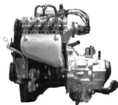
汽油机左视外形图: