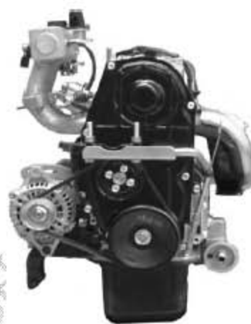
汽油机前视外形图: