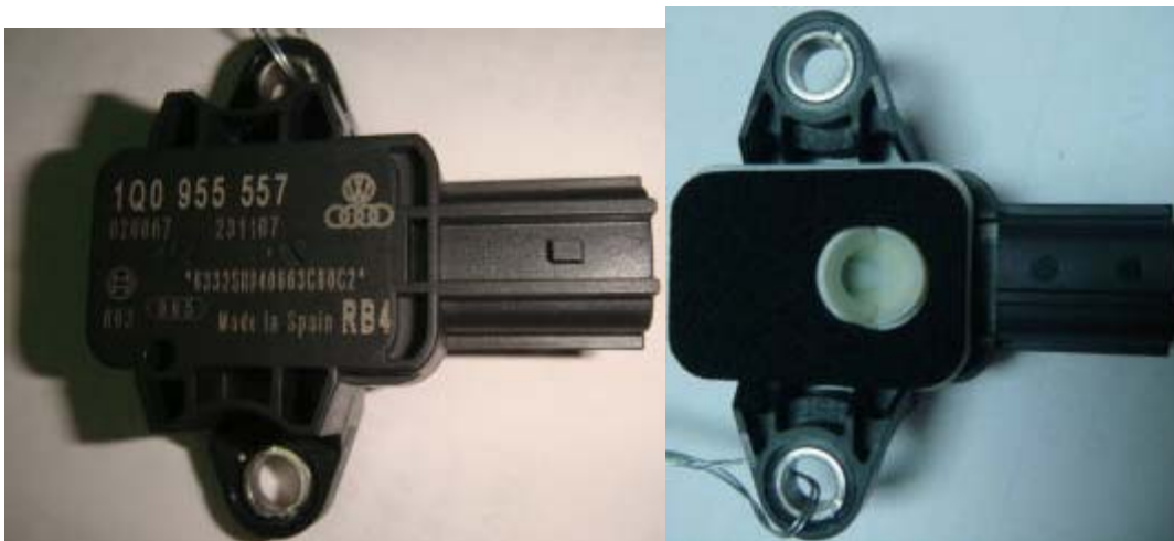
侧面碰撞传感器(左图为正面，右图为反面)